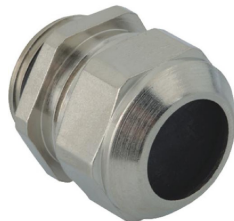
M-WADI / M-WADIZ