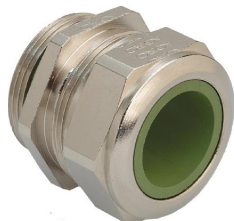
M-WADI-HT / M-WADIZ-HT