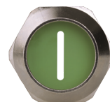
Flachkabeleinsätze flat cable inserts