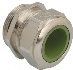
M-WADI-HT / M-WADIZ-HT