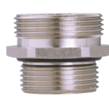
Langes Gewinde long thread